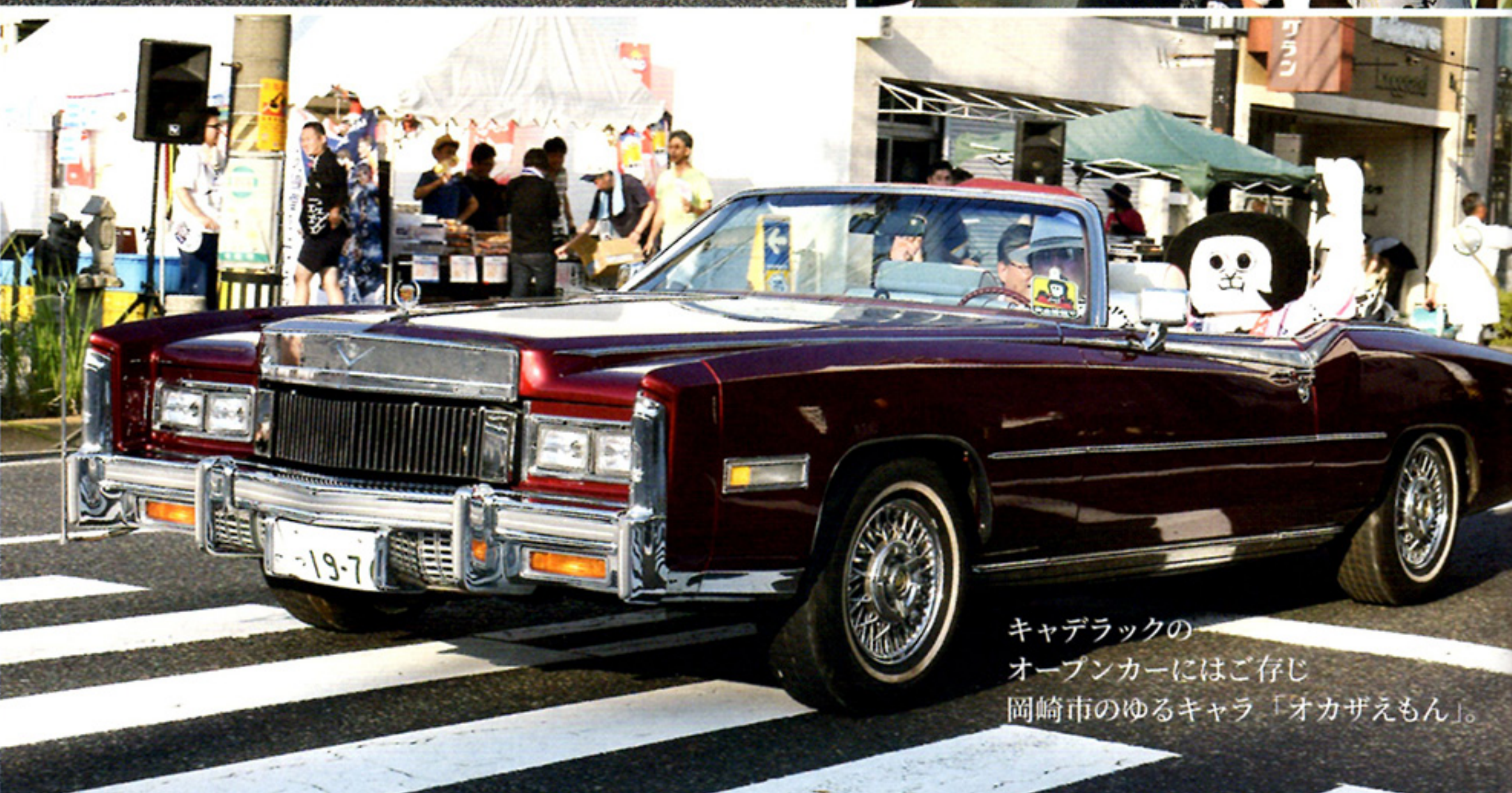
キャデラックのオープンカーにはご存じ岡崎市のゆるキャラ「オカザえもん」。