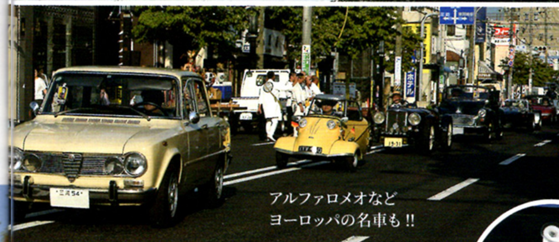
アルファロメオなどヨーロッパの名車も!!