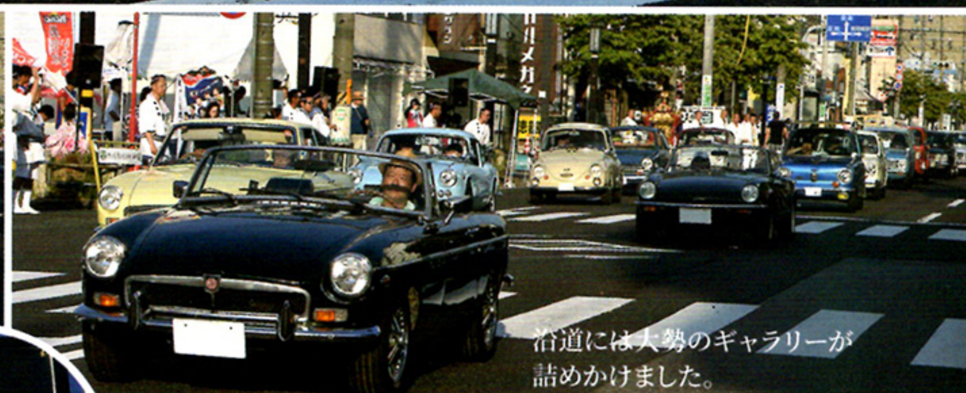
沿道には大勢のギャラリーが詰めかけました。