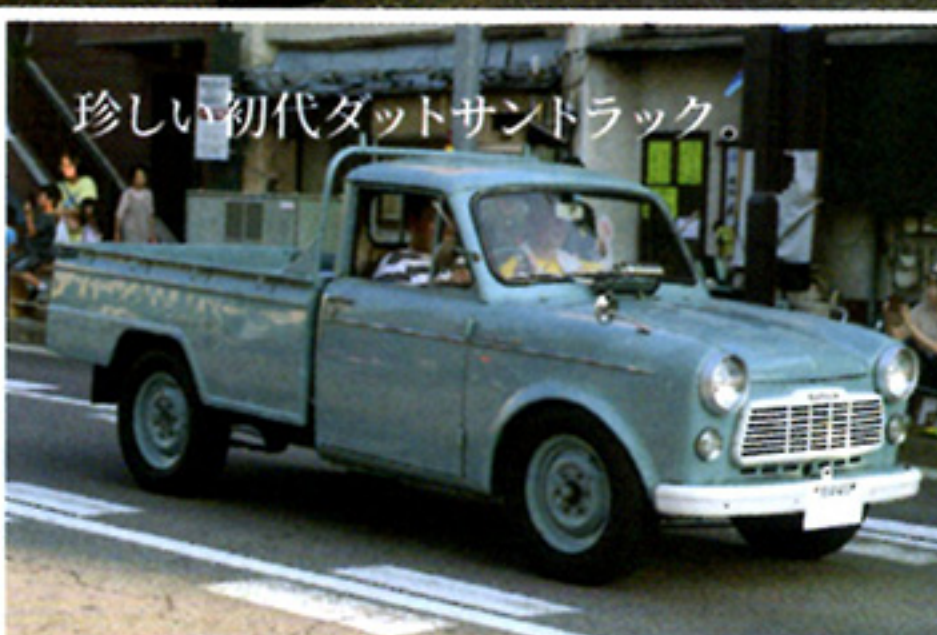
珍しい初代ダットサンドラック。