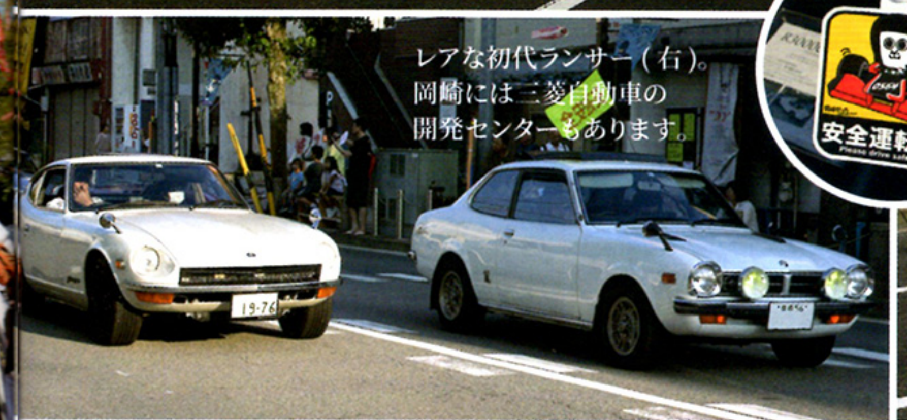
レアな初代ランサー (右)。岡崎には三菱自動車の開発センターもあります。