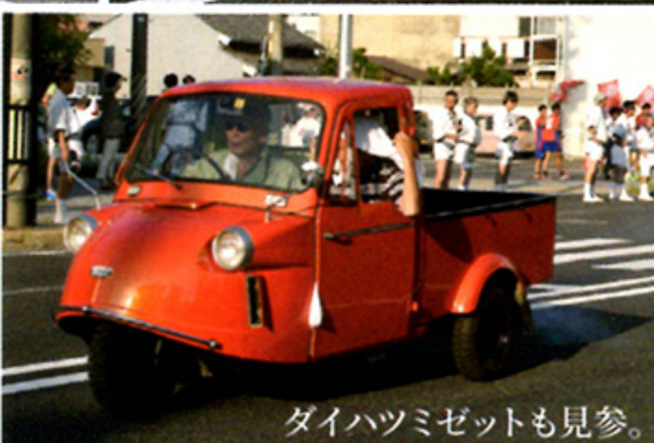
ダイハツミゼットも見参。