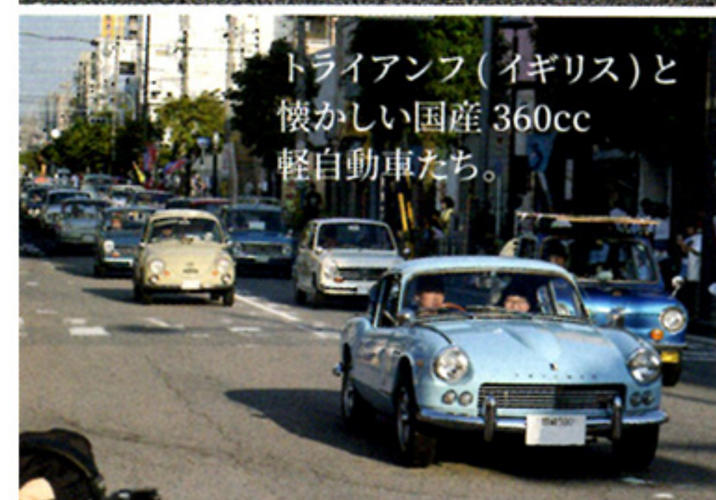
トライアンフ (イギリス) と懐かしい国産 360cc 軽自動車たち。