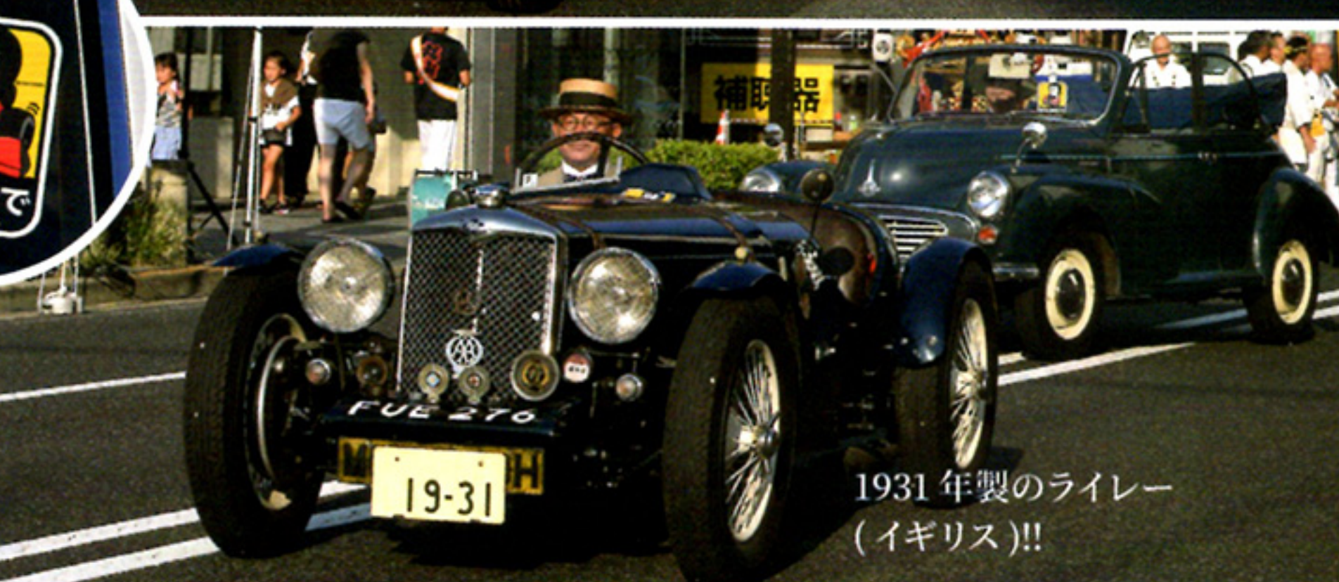
1931年製のライレー (イギリス)!!