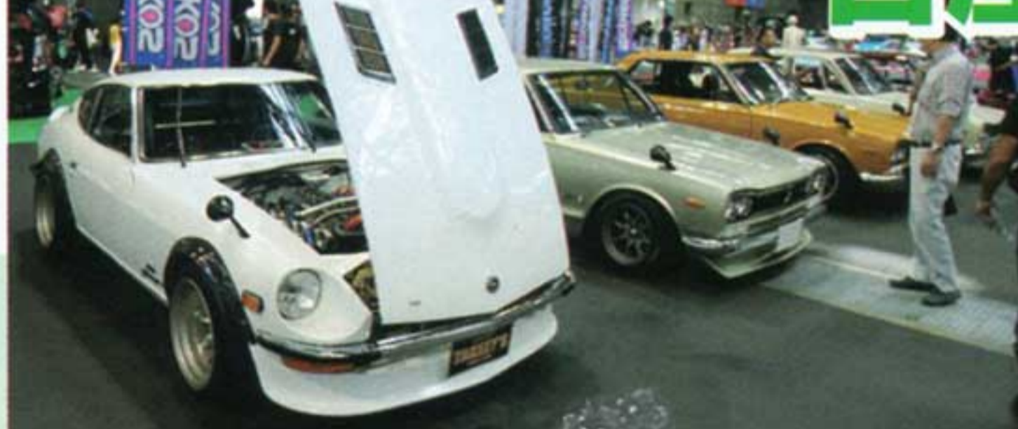
こちらは抜群の程度と走りそうなチューンのS30、そしてハコスカがズラリと並ぶ...圧巻ですね