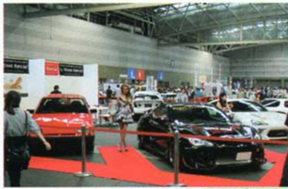
ハチロク/BRZはイベントに多く参加するようになってきた。街で見かける機会も多くなってきたしね。隣は程度抜群の鉄仮面