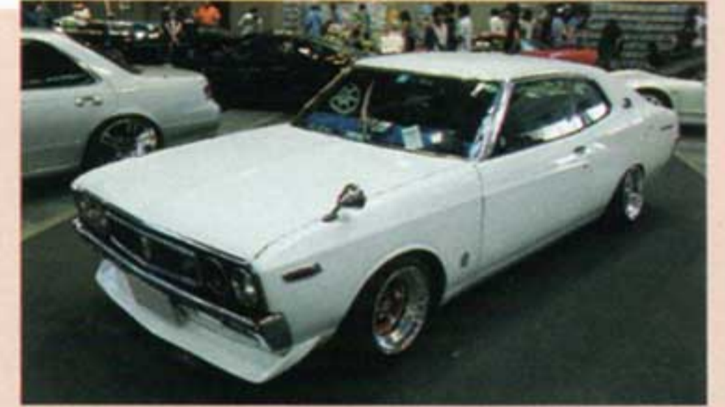
程度の良い130系はホント少なくなってきた...今持っている人は宝物なので大事にして欲しい限りです