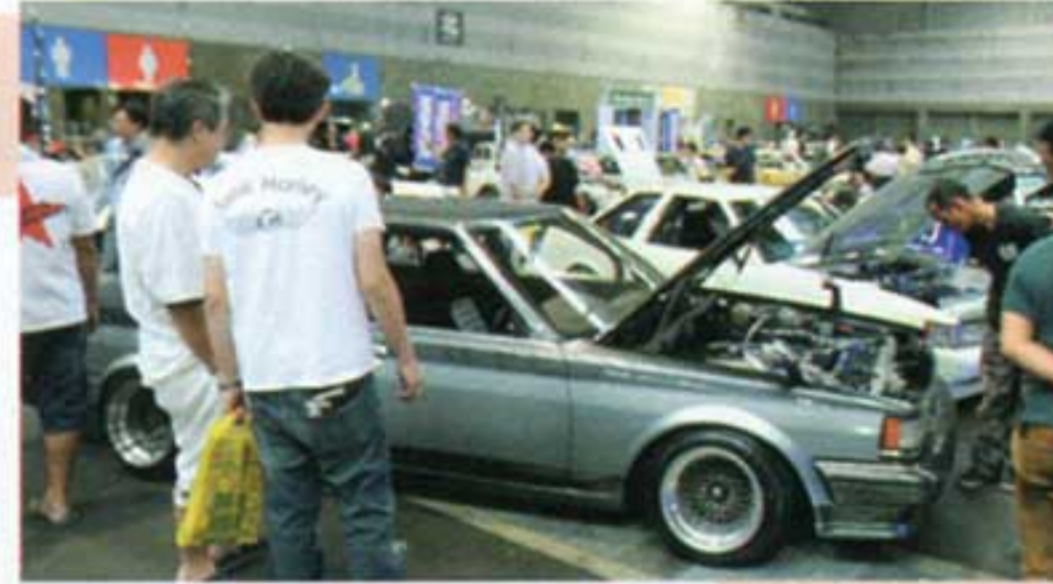
ラウンドエンジニアリングが持ち込んだ70系と10系は終始大人気!!10には話題のライジングガレージ製スロットルが装着されていた!!