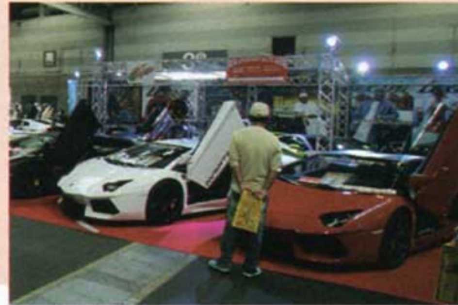
ランボルギーニ・アベンタドールですか?あまりに日常からかけ離れすぎているクルマすぎてしまうので、見る方も緊張してしまうけどやっぱりこの迫力はランボだよな!