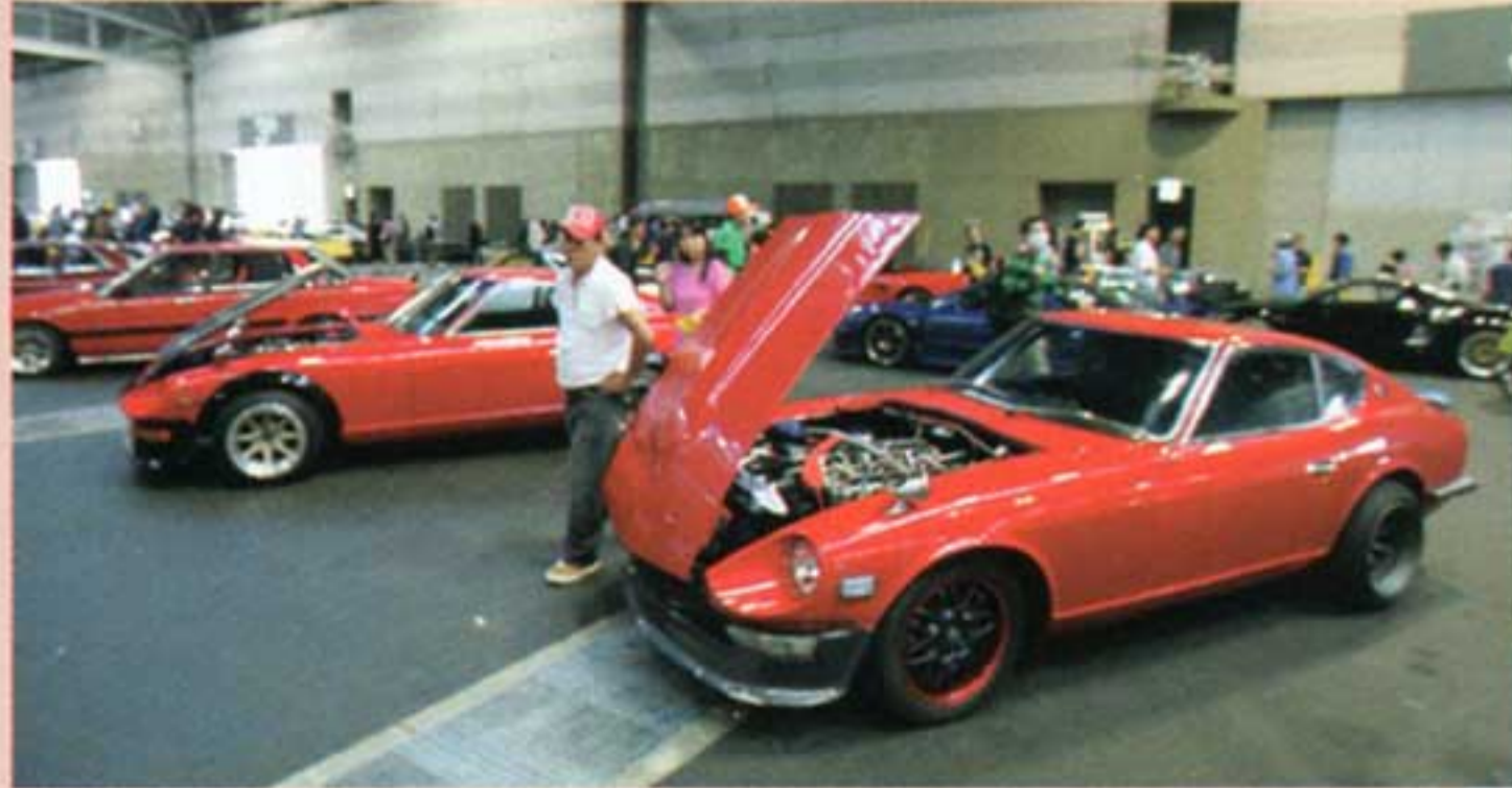
こちらは"赤"コーナー?かなり渋い&走りによつたいじり方はやっぱりS30系の王道的チューニングだね