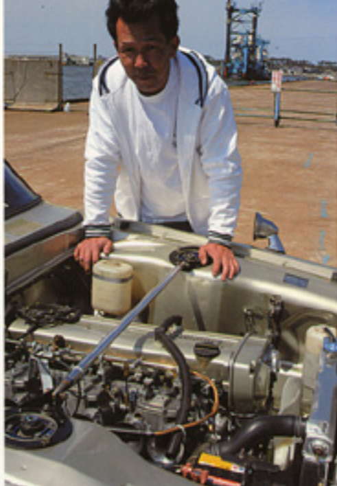
RB25エンジンの走りに大満足の様子。

取材者から一言 ロッキーオートさんより納車されたばかりの車を中心に、多くのクラブのお友達に囲まれての取材でしたが、その雰囲気から80年代に戻ったような気持ちになりました。この車のために車庫も作ったほどの気合の入れようですので、あまり飛ばさないようにかわいくなってください。