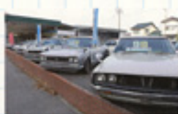
屋外にはリーズナブルな展示車が並び、満ちる車もご希望に応じて。