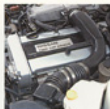
現行車のエンジン-RB20とオートマで快適ドライブが実現。