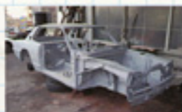
エンジンルーム内から同色仕上げ。