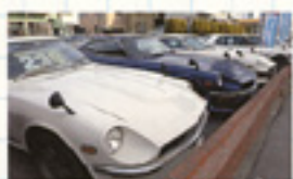
圧倒される在庫台数。ベース車も仕上げ済みの車もご希望に応じて。