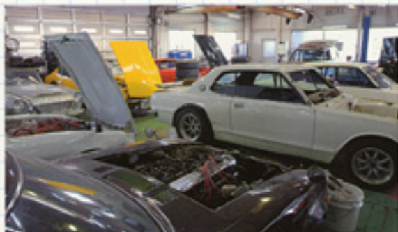
複数台のクルマの作業が同時進行するガレージ。