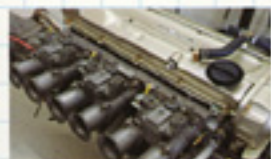
RBエンジン、キャブ換装。